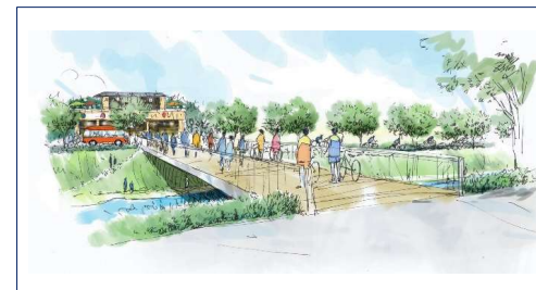
橋梁と賑わいのイメージ